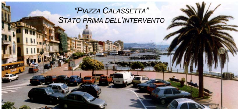
“PIAZZA CALASSETTA” STATO PRIMA DELL’INTERVENTO

PAVIMENTATA INTERAMENTE CON MASSELLI DI GRANITO DI DIVERSA COLORAZIONE.