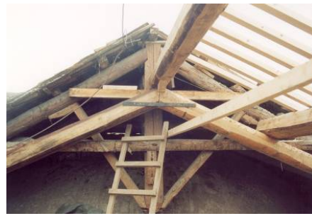
Fase di posa dell'orditura primaria e secondaria – Particolare delle legature in acciaio