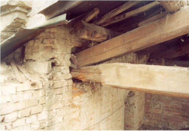
Particolare dell'ammaloramento delle capriate lignee nei punti di connessione con la muratura