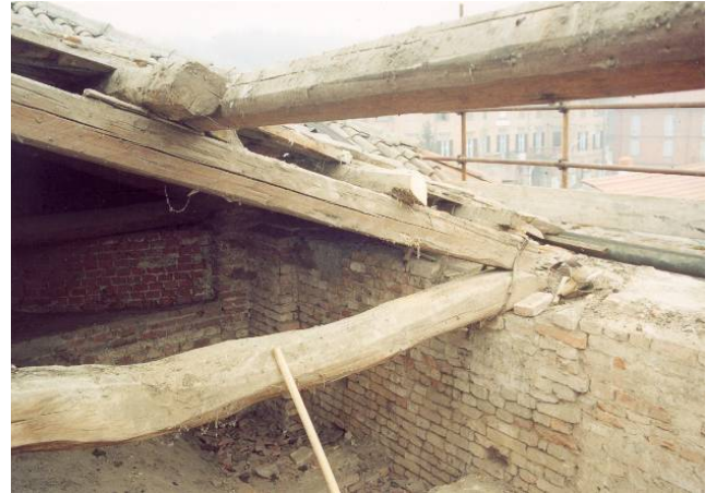
Particolare dell'ammaloramento delle capriate lignee nei punti di connessione con la muratura