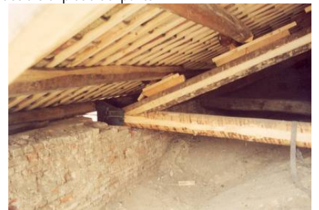
Particolare dell'interno in fase di ultimazione