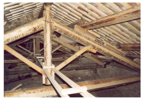
Particolare dell'interno a lavoro ultimato