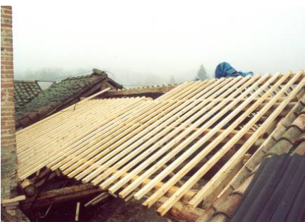
Fase di posa dell'orditura secondaria