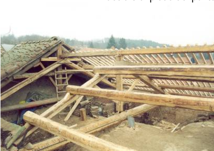
Fase di posa dell'orditura primaria e secondaria