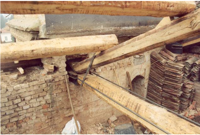
Ripristino e sostituzione delle capriate e predisposizione dei tiranti in acciaio al piede dei puntoni