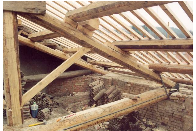
Ripristino e sostituzione delle capriate e predisposizione dei tiranti in acciaio al piede dei puntoni