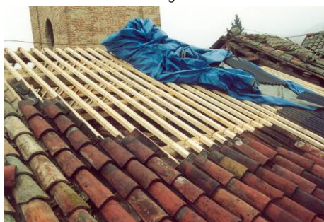
Posa degli elementi in laterizio recuperati